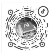
铂锐 AI 灯光学堂 (AI 云智控实操视频)