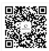
铂锐官方微信号 (产品资讯/企业信息)